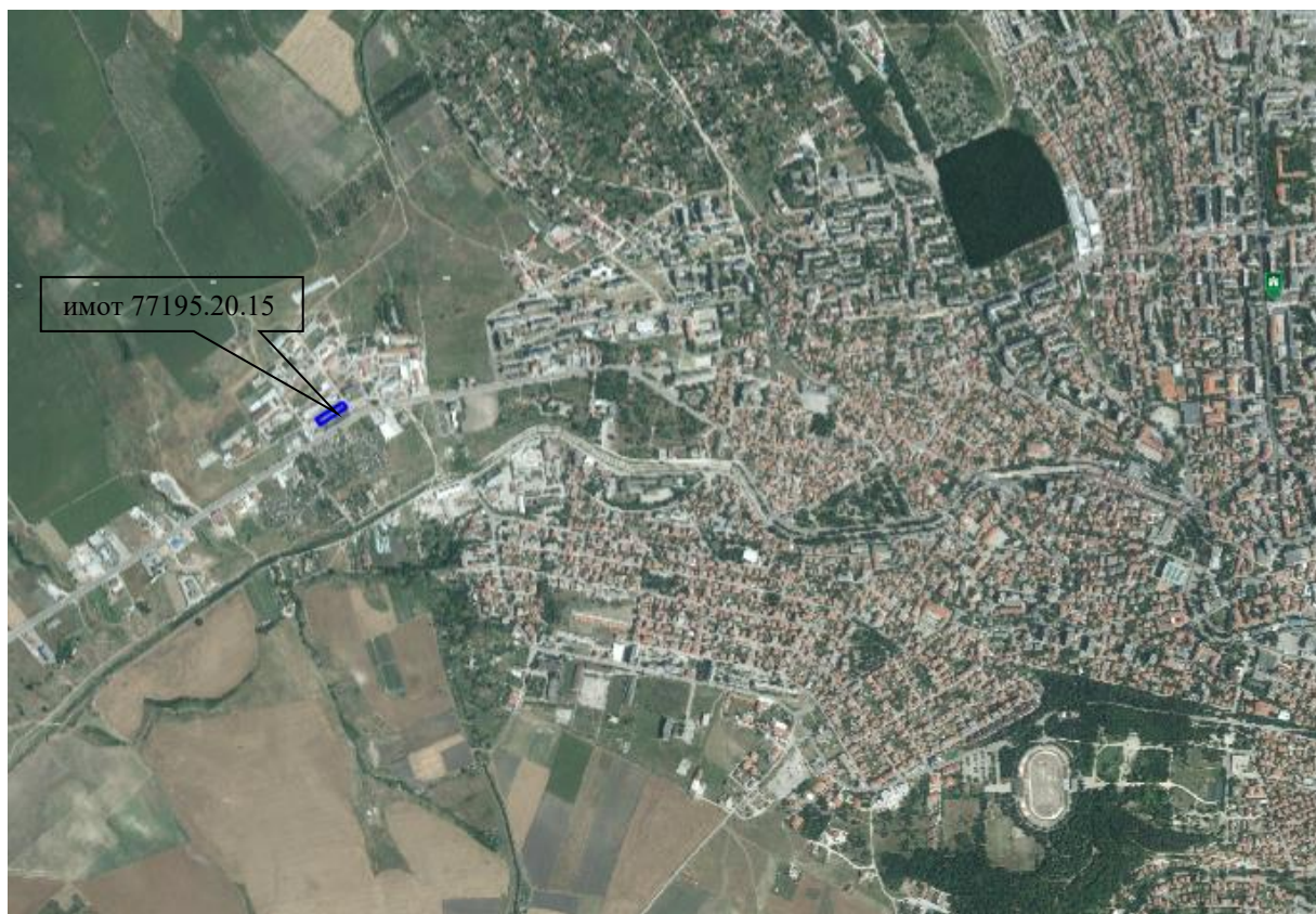
Фигура 1. Местоположение на поземлен имот с идентификатор 77195.20.15 в местността „Дерекьой топра”, в град Хасково, община Хасково

Дейността ще се реализира в поземлен имот с идентификатор 77195.20.15 с площ 1414 кв.м, в местността „Дерекьой топра”, в град Хасково, община Хасково, област Хасково.