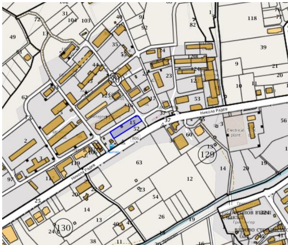
Фигура 2. Местоположение на имот с идентификатор 77195.20.15, се намира в м. „Дерекьой топра“, гр. Хасково, Община Хасково

Имотът не засяга защитени територии по смисъла на Закона за защитените територии и не попада в границите на защитени зони (Натура 2000 места) по смисъла на Закона за биологичното разнообразие.